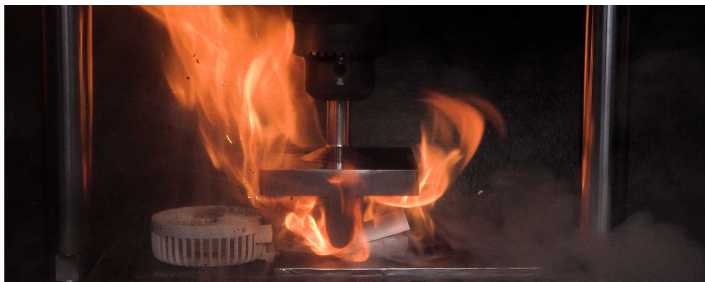
携帯用扇風機に圧力をかける再現試験の様子